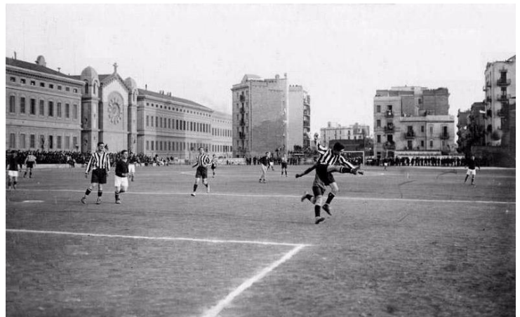
2. Camp al carrer Villarroel / Rosselló (a la dreta el passatge Batlló)

Va ser en alguns camps de futbol ubicats en l'Esquerra de l'Eixample on el FC Barcelona va començar la seva trajectòria com a club, en uns moments difícils econòmicament i en plena expansió urbana.