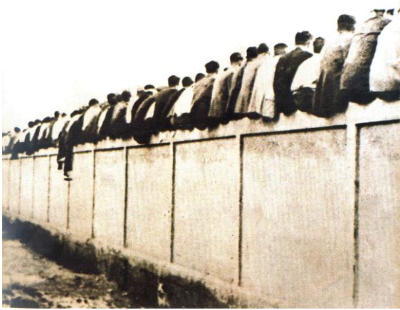
6. Els culs dels aficionats a la tàpia del carrer Indústria. Origen de la paraula "culers"

situació privilegiada al nucli urbà de la ciutat comtal donaren l'empenta decisiva al barcelonisme. Fins i tot es comença a configurar l'imaginari culer amb la gènesi precisament d'aquesta paraula: els culs arrencats a la tàpia del camp del carrer de la Indústria a la vista dels vianants va propiciar aquest apel·latiu.