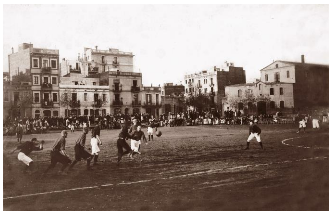
3. Camp del carrer Muntaner. Al fons es pot veure la cantonada de Muntaner / Coello (actualment Londres)

La nova destinació fou l'antic terreny d'un altre club barceloní, l'Hispania AC que va jugar entre els anys 1902 i 1903, any de la desaparició del club. Es tractava d'un solar sense edificar delimitat pels carrers de París, Casanovas, Londres i Muntaner, on era l'entrada principal. Avui dia es una illa de cases. El terreny feia 97 metres de llarg per 65 d'ample. No tenia tanques de cap classe i des dels carrers circumdants es podia presenciar sense cap tipus de problema els partits que es disputaven.