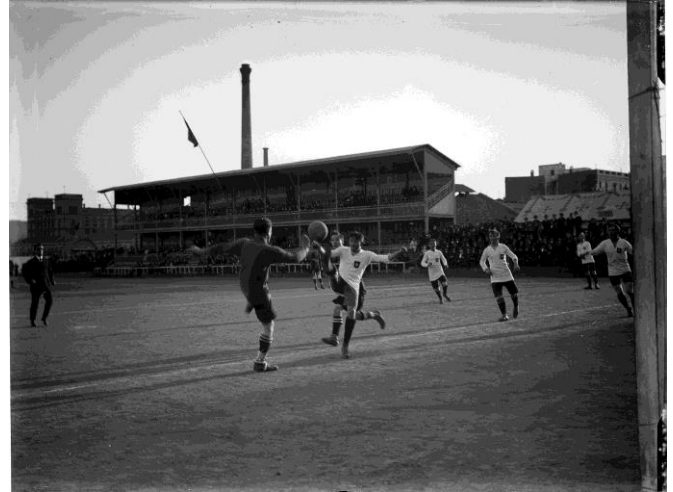
5. Camp del carrer Indústria amb la nova tribuna de 2 pisos el 1916 Al fons l'edifici de la fàbrica Batlló.