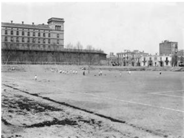
1. Camp al carrer Rosselló / Urgell

A finals del segle XIX i principis del XX va ser l'arribada a Barcelona del futbol, un nou esport de procedència anglesa que any rere any va experimentar una gran popularitat, arrelant molt ràpidament en la societat barcelonesa. En aquest disseny quadriculat de l'Eixample varen proliferar camps de futbol, velòdroms etc., que després l'especulació urbanística va fer desaparèixer. En les illes, que encara eren solars, properes a la fàbrica Batlló (actual escola Industrial) i l'edifici de l'Hospital Clínic varen proliferar camps de futbol per a la pràctica d'aquest nou esport, com per exemple el camp que mostra la imatge, en la cruïlla del carrer Rosselló amb Comte d'Urgell on veiem l'edifici de la fàbrica Batlló, o l'altra imatge on es veu el camp on jugava l'Espanya junt a l'edifici original de l'Hospital Clínic i l'església que hi havia davant del carrer Rosselló i que ara s'ubica l'entrada principal de l'hospital.