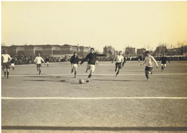
4. Camp del carrer Indústria el 1912. Al fons l'Hospital Clínic

El camp del carrer Indústria (avui París) també estava ubicat en el districte de l'Eixample, com el seu antecessor del carrer Muntaner, però s'havia convertit en el veritable motor de l'expansió del club a partir de 1909. Estava situat a dues travessies del camp del carrer Muntaner, a l'illa formada pels carrers Londres, París, Urgell i Villarroel, un terreny actualment urbanitzat. La seva inauguració es dugué a terme sense cap cerimònia especial, amb la disputa d'un partit corresponent al Campionat de Catalunya amb el Català (2-2), el 14 de març de 1909. El camp del carrer de la Indústria, conegut popularment com l'Escopidora , per les petites dimensions que tenia, fou a l'època el millor camp de Catalunya i, a partir del 1914, el primer de Catalunya que tingué enllumenat elèctric. Tenia al costat un xalet el primer pis del qual fou utilitzat durant un cert temps com a local social del club i la planta baixa com a bar.