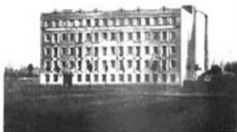
3. Pianos Chassaigne Freres