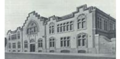
4. Editorial Salvat