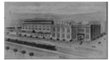
2. Fabrica Font- Campabadal

10. Anglo Española de Electricidad, fàbrica de electrodomèstics (ràdios, tocadiscos, reproductors, gramols..) ubicada a la Av. de la Gran Via, 525 cantonada Urgell.