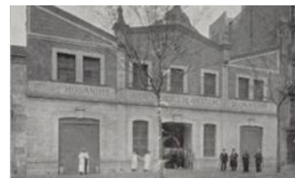
12. Orsola i Cia

24. Tallers Abadal, fàbrica (de Fco Serramalera) d'automòbils L'empresa creada el 1887 fou instal·lada en diferents indrets de l'Eixample i especialment en la Pl. Letamendi, 17 en un edifici modernista obra de Sagnier, destruït a mitjans dels anys 1920.