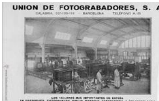
7. Unión de Fotograbadores