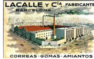
14. Lacalle i Cia.