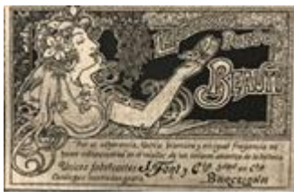
1. Perfumeria Font