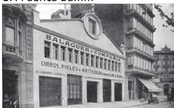
19. Balaguer i Cia