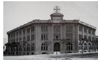
16. Ind. Esp. Perlas de Imitación