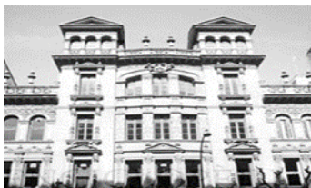
11. Editorial Sopena