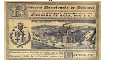
8. Refineria Barcelonesa