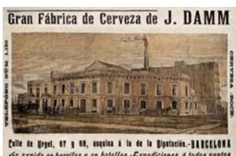
17. Fàbrica Damm