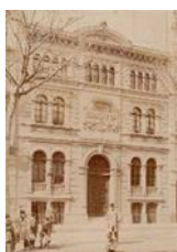
23. Editorial Espasa

11. La Editorial Sopena es va establir a inicis del s. XX al c/ Provença 95 entre c/ Viladomat i Comte Borrell.