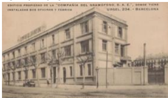
15. Cía de Gramófonos Odeón