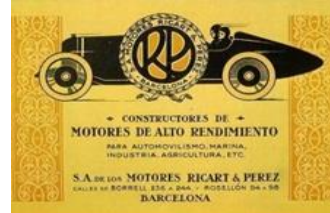
20. Motores Rex S.A. Ricart Pérez