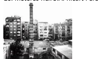
22. Fàbrica Lehmann