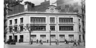
10. Anglo Española de Electricidad